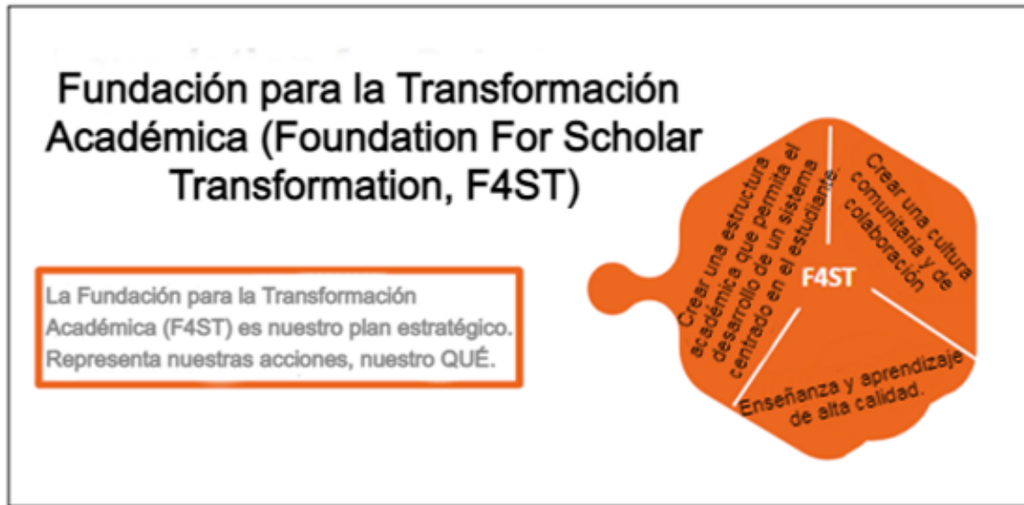
Figura 4.2 (Áreas de enfoque de la F4ST)

Al igual que otras escuelas, The Preuss School UC San Diego experimentó una gran interrupción en la continuidad de la instrucción cuando hizo la transición al aprendizaje a distancia y de regreso. Los programas y logros educativos obtenidos antes del cierre de las escuelas, que se ordenó en respuesta a la pandemia de COVID-19, fueron rápidamente borrados por los desafíos que enfrentaron los estudiantes, el cuerpo docente y el personal durante la educación a distancia. La pandemia puso de relieve las desigualdades existentes y exacerbó las oportunidades y las brechas de aprendizaje para los estudiantes.