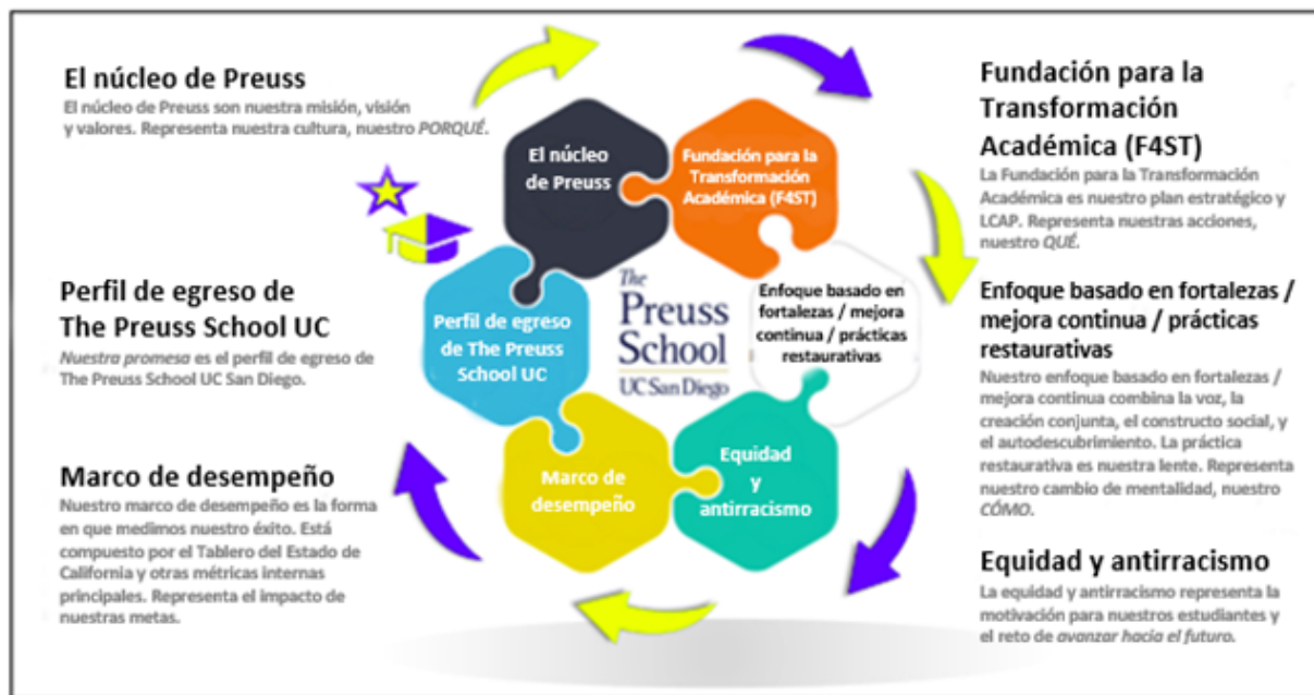
Figura 4.1 (Gráfico del panorama general de Preuss)

Si observamos la F4ST más de cerca, hay tres áreas de enfoque: construir una cultura comunitaria y de colaboración, enseñanza y aprendizaje de alta calidad, y crear una estructura escolar que permita el desarrollo de los sistemas centrados en los estudiantes (Figura 4.2). Las metas creadas del Autoaprendizaje de The Preuss School se agregarán a estas áreas de enfoque. Durante nuestra revisión anual de la F4ST, se podrían hacer modificaciones en las áreas de enfoque. Los datos del Autoaprendizaje de The Preuss School serán parte de esa revisión.